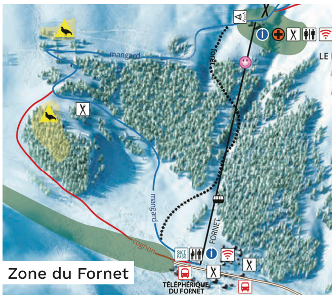
Zone du Fornet

Elles sont délimitées par des rangées d'élastiques rouges dotés de fanions jaunes et en amont par une signalétique, permettant de canaliser le flux des skieurs à l'extérieur des zones à enjeux.